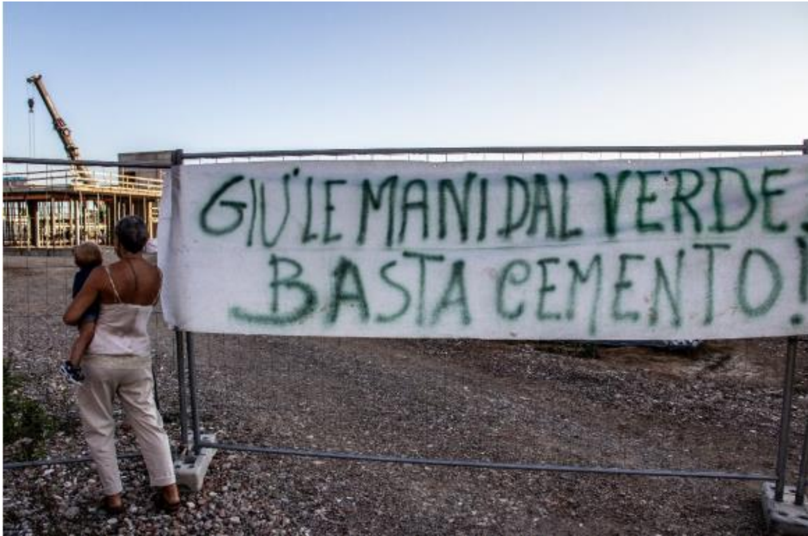
Figura 66. "Il futuro non cresce sul cemento", foto tratta dal concorso fotografico "uno scatto per raccontare il cambiamento", scattata da Roberta Diciotti il 31 luglio 2025 in Via S. Marino, nel comune di Livorno