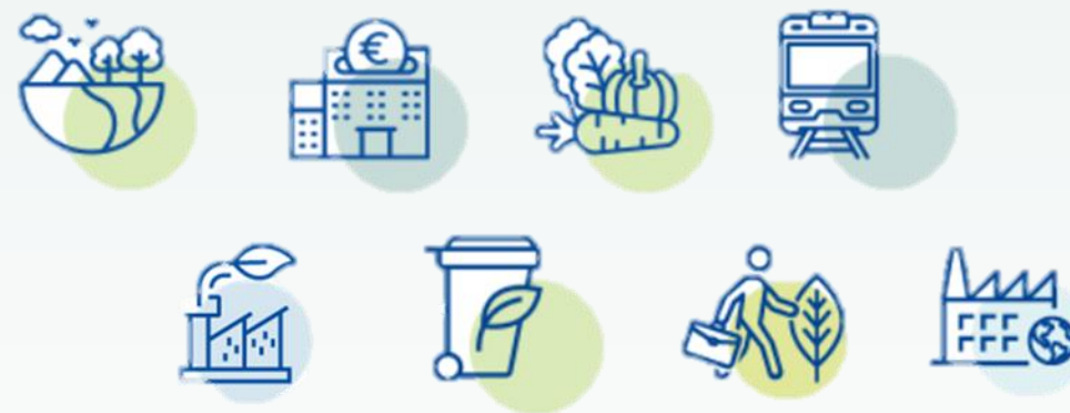
I vantaggi del Green Deal europeo